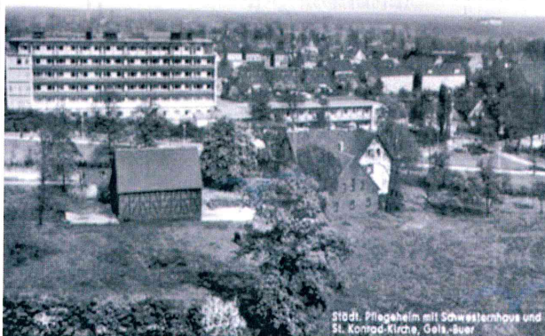
Abb.2 : Reste des Hofes Schulte-Middelich nach Errichtung des Altersheimes Hauerfeld (Hintergrund)