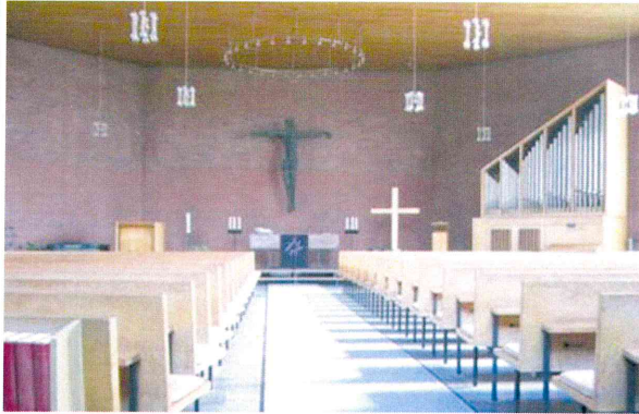
Abb. 5: Blick auf die Altarinsel vor 2009