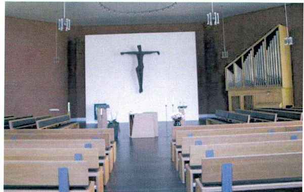
Abb. 6: Blick auf die Altarinsel nach 2009, Quelle: LWL-DLBW 2016