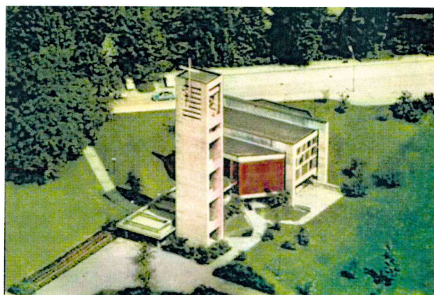
Abb. 4: Luftbild nach Fertigstellung von Kirche und Außenanlagen.