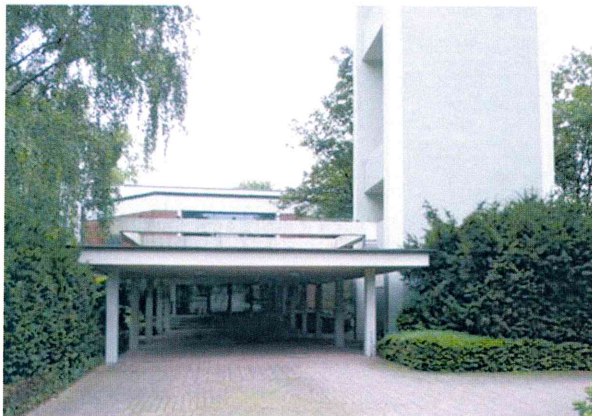
Abb. 8: Gang und Campanile