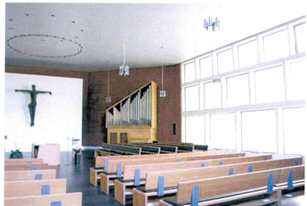
Abb. 9: Blick östliche Glaswand, Quelle: LWL-DLBW 2016.