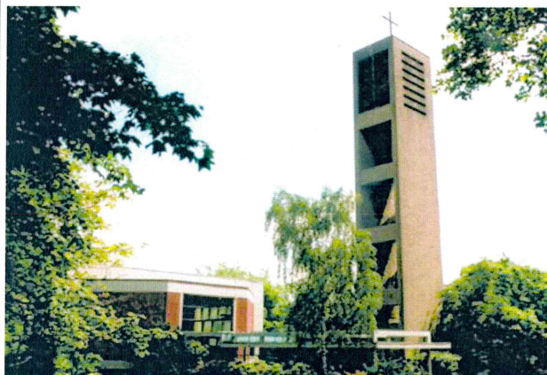
Abb.3: Eingang mit Gang und Campanile, Mitte der 1990er Jahre, Quelle: Matthäuskirche 50 Jahre.