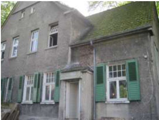
Abb. 2: Hofansicht der Haushälfte Velsenstraße 18a Aufnahme: 2017