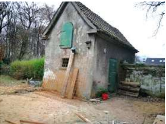
Abb. 3: Velsenstraße 18a, Nebengebäude Aufnahme: 2018