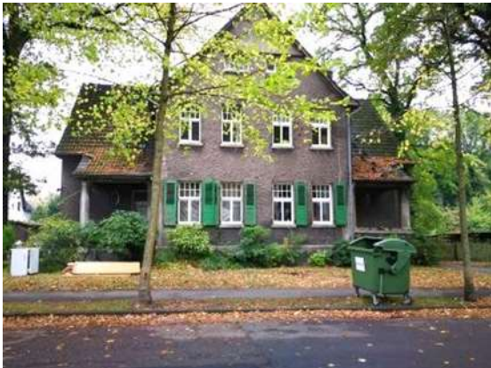
Abb. 1: Straßenansicht des Gebäudes Velsenstraße 18/18a Aufnahme: 2018